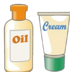
〈適度な潤いを与える〉