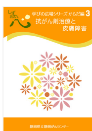
抗がん剤治療と皮膚障害