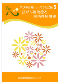
抗がん剤治療と末梢神経障害