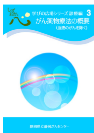
がん薬物療法の概要 (血液のがんを除く)