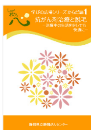
抗がん剤治療と脱毛