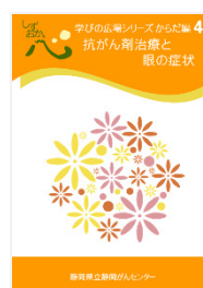
抗がん剤治療と眼の症状