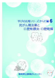
抗がん剤治療と口腔粘膜炎・口腔乾燥