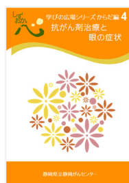
抗がん剤治療と眼の症状