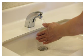
①手を流水でぬらす