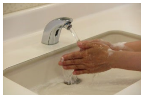
⑨流水でよくすすぐ