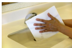
⑩こすらずに水分を 拭き取る