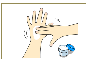
⑪ハンドクリームで 保湿