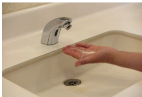
②石けんを適量取り出す