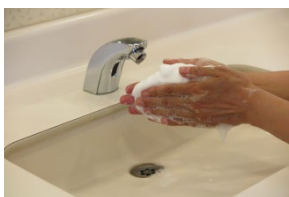
③石けんを泡立てる