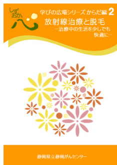
放射線治療と脱毛