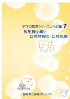
放射線治療と 口腔粘膜炎・口腔乾燥