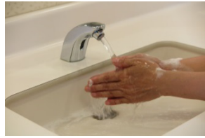
⑨流水でよくすすぐ