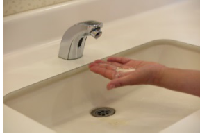
②石けんを適量取り出す