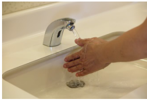
①手を流水でぬらす