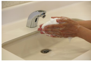
③石けんを泡立てる