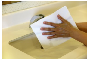
⑩こすらずに水分を拭き取る