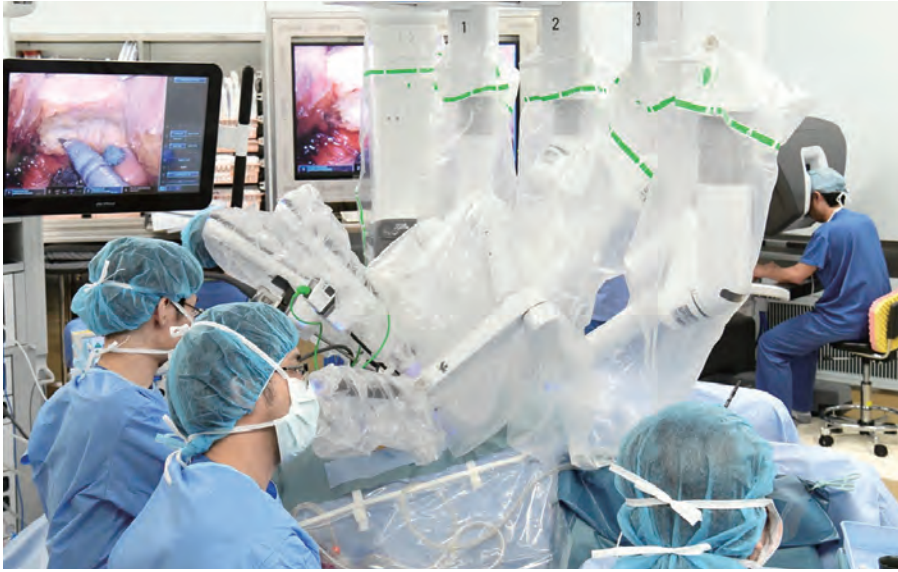
低侵襲性治療の国内拠点。 手術支援ロボット、ダ・ヴィンチによる大腸がん手術