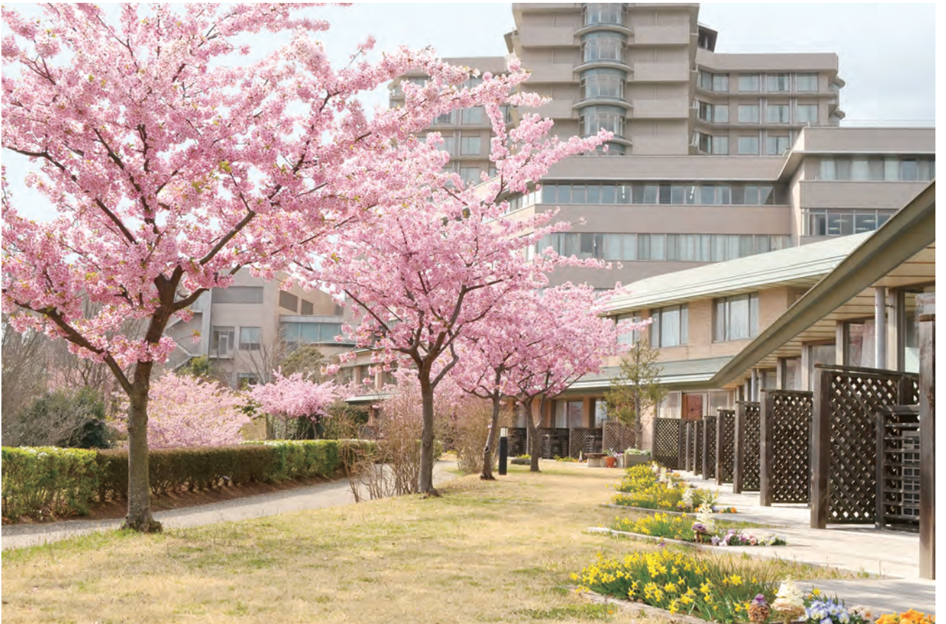
緩和ケア病棟の早咲きの河津桜