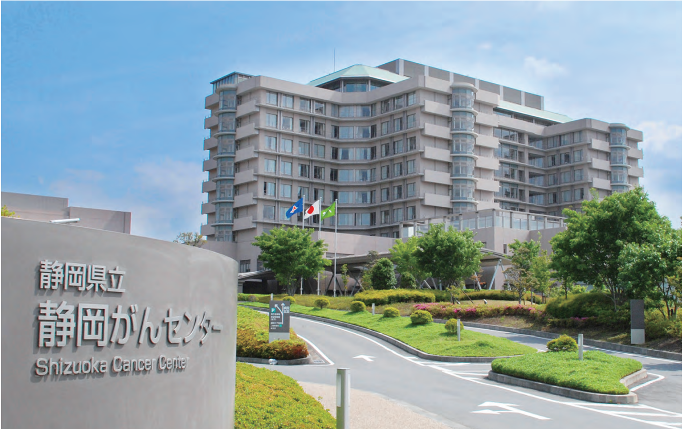
静岡県立静岡がんセンター病院棟。全国がん医療3大拠点の一つ