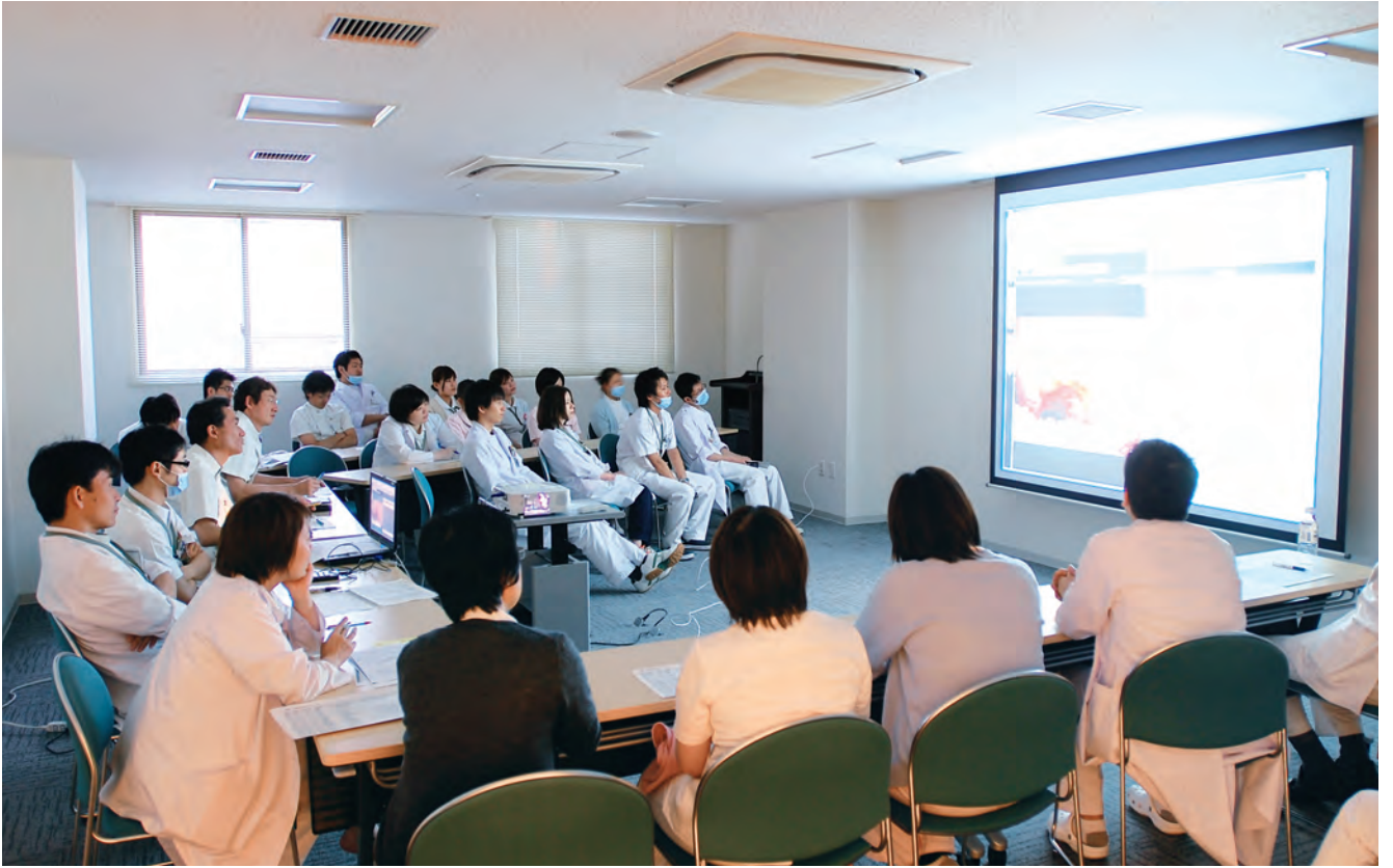
多職種カンファレンス。難しい症例について最善の治療・ケア方針を決定