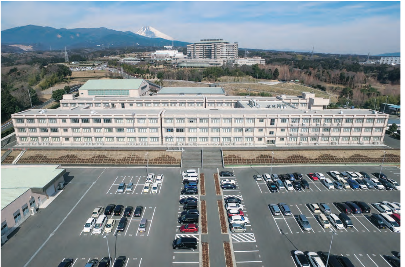
静岡がんセンターに隣接するファルマバレーセンター新拠点。旧長泉高校を改修