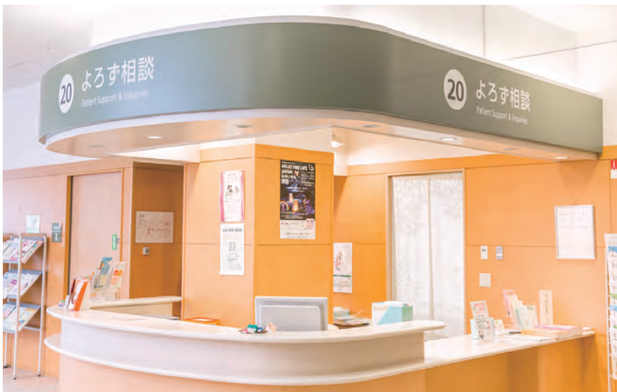
がんよろず相談。年間1万数千件に対応。 全国のがん拠点病院に設置されている相談支援センターのモデル