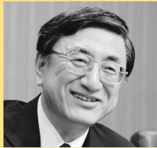
山口 建氏 (がんセンター総長)

年間延べ20万人の外来患者が訪れ、3,000件以上の手術を手掛ける静岡がんセンター。患者や家族の声に耳を傾け、国内屈指の最先端医療を施しています。その最前線に立つ医師、看護師らから、検診、診断、がんと向かい合うための心構え、治療、緩和医療を体系的に学び、がん治療の受け方を考えます。毎回、「質疑応答・タウンミーティング」の時間を設けるほか、アンケートで質問を募り、がんセンターと受講者の「双方向の講座」を心掛けます。