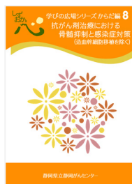
抗がん剤治療における 骨髄抑制と感染症対策