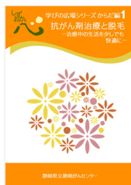
抗がん剤治療と 脱毛