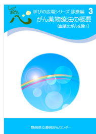
がん薬物療法の 概要 (血液のがんを除く)