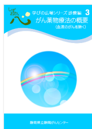
がん薬物療法の概要 (血液のがんを除く)