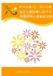
抗がん剤治療における骨髄抑制と感染症対策