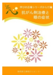
抗がん剤治療と眼の症状