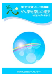
がん薬物療法の概要 (血液のがんを除く)