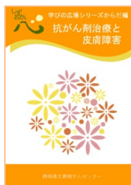
抗がん剤治療と皮膚障害