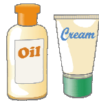
〈適度な潤いを与える〉