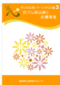
抗がん剤治療と 皮膚障害