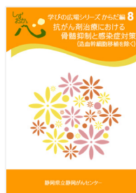
抗がん剤治療における 骨髄抑制と感染症対策 (造血幹細胞移植を除く)