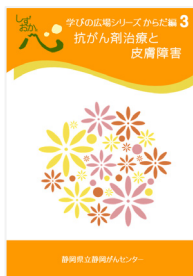
抗がん剤治療と 皮膚障害