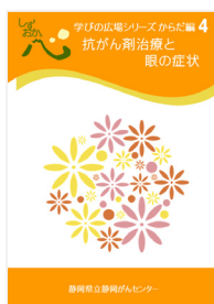
抗がん剤治療と 眼の症状