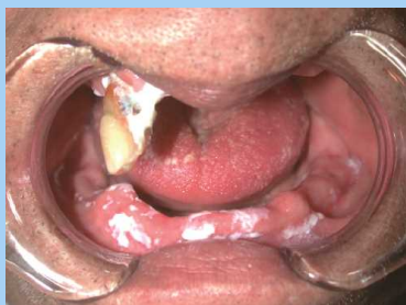
《カンジダ性口内炎》