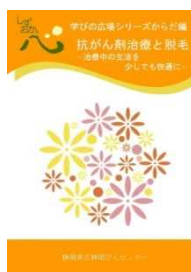
抗がん剤治療と脱毛