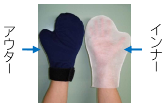
フローズングローブ (手を冷やすためのアイテム)

さらに、日常生活の中でも手足の保湿と保護する対策が大切です。「一般的なケア」(25~36ページ)を参考にして、できることから始めて下さい。近年では、点滴開始前から終了後まで、手や足を冷却すると症状が抑えられることがわかり、実施されています。