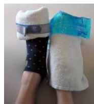
冷却ジェルの利用