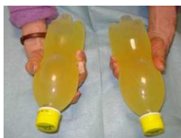
ペットボトルによる 簡易冷却法(冷水)