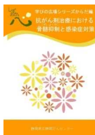
抗がん剤治療における 骨髄抑制と感染症対策