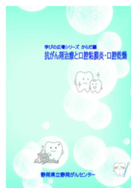
抗がん剤治療と 口腔粘膜炎・口腔乾燥