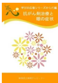
抗がん剤治療と 眼の症状