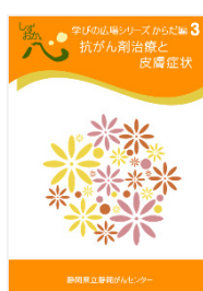
抗がん剤治療と皮膚障害