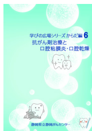
抗がん剤治療と口腔粘膜炎・口腔乾燥