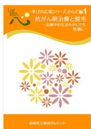
抗がん剤治療と脱毛