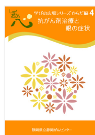
抗がん剤治療と眼の症状