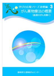
がん薬物療法の概要 (血液のがんを除く)