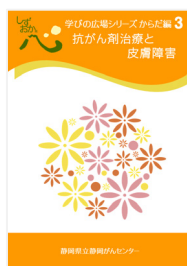
抗がん剤治療と皮膚障害