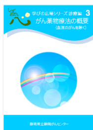
がん薬物療法の概要 (血液のがんを除く)