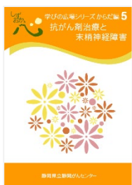
抗がん剤治療と末梢神経障害