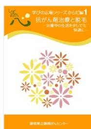
抗がん剤治療と脱毛