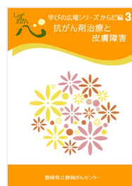
抗がん剤治療と皮膚障害