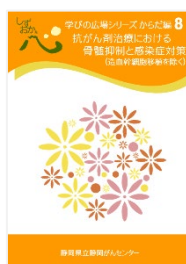
抗がん剤治療における骨髄抑制と感染症対策