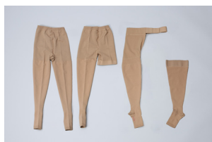
〈弾性ストッキング〉