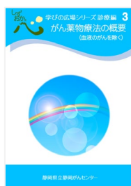
がん薬物療法の概要 (血液のがんを除く)