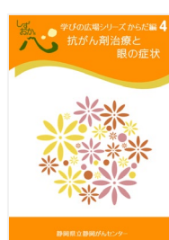
抗がん剤治療と 眼の症状