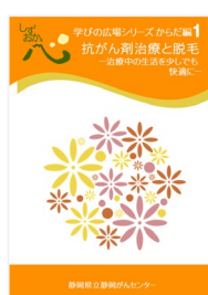
抗がん剤治療と 脱毛