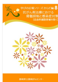
抗がん剤治療における 骨髄抑制と感染症対策