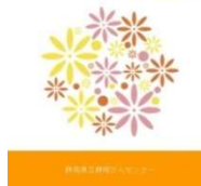
抗がん剤治療と末梢神経障害