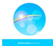
がん薬物療法の概要 (血液のがんを除く)