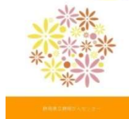
抗がん剤治療と皮膚障害