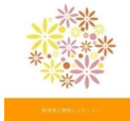
抗がん剤治療における骨髄抑制と感染症対策