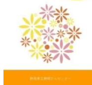
抗がん剤治療と眼の症状