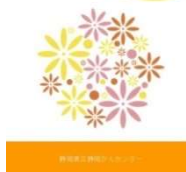
抗がん剤治療と脱毛