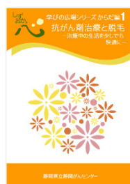
抗がん剤治療と脱毛