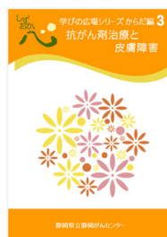
抗がん剤治療と皮膚障害