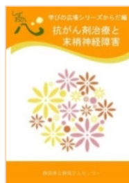
抗がん剤治療と末梢神経障害