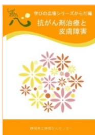
抗がん剤治療と皮膚障害