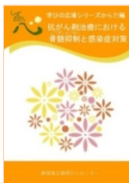
抗がん剤治療における骨髄抑制と感染症対策