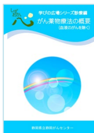
がん薬物療法の概要 (血液のがんを除く)