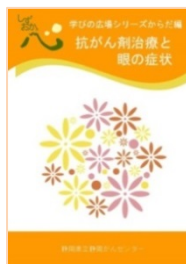
抗がん剤治療と眼の症状