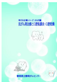
抗がん剤治療と口腔粘膜炎・口腔乾燥