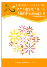
抗がん剤治療における 骨髄抑制と感染症対策