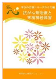
抗がん剤治療と 末梢神経障害