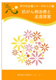
抗がん剤治療と 皮膚障害