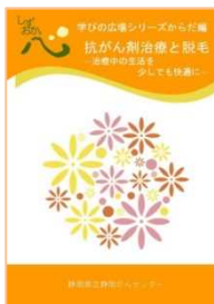
抗がん剤治療と脱毛