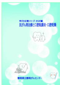
抗がん剤治療と 口腔粘膜炎・口腔乾燥