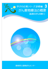
がん薬物療法の 概要 (血液のがんを除く)