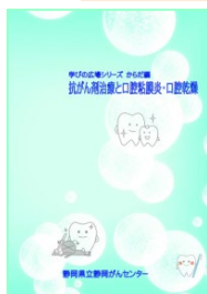
抗がん剤治療と口腔粘膜炎・口腔乾燥