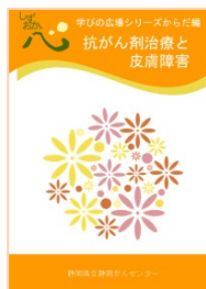
抗がん剤治療と皮膚障害