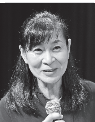
県立静岡がんセンター 腫瘍精神科部長

これは著しい苦痛や重要な機能障害を引き起こす睡眠困難が、週3日以上で3カ月以上続くことと診断されます。入眠困難、睡眠維持困難、早朝覚醒、よく寝た感じがしない、などがあり、治療ではタイプ別に睡眠薬の種類が変わります。従来型の睡眠薬としてベンゾジアゼピン系と非ベンゾ(Z系)が多く使用されてきました。これらは日中の倦怠や認知機能の低下、転倒骨折や長期使用で依存性が高まります。睡眠の質も低下し、昼間に反跳性の不安が起きます。当院の標準的な薬物療法は、